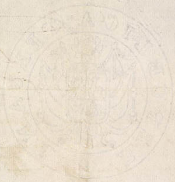
EXHIBIT NO. 2

Handwritten text, possibly a signature or date, located below the central seal.