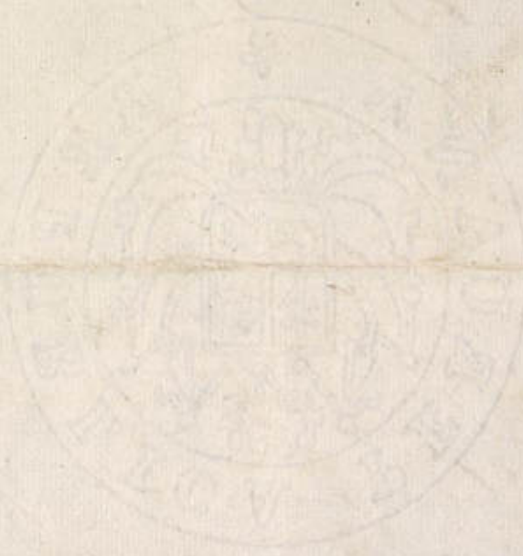
Fig. 1. sug. de in roll.