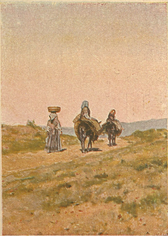
CAMINO DEL MERCADO