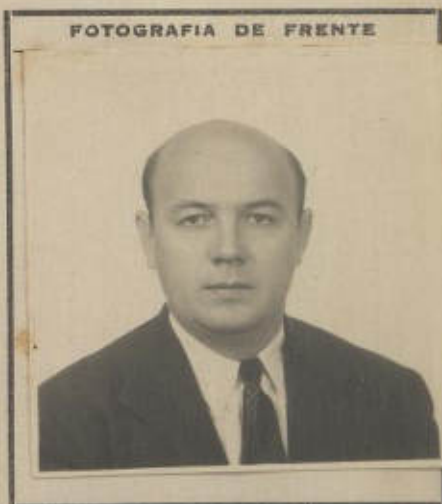
FOTOGRAFIA DE FRENTE