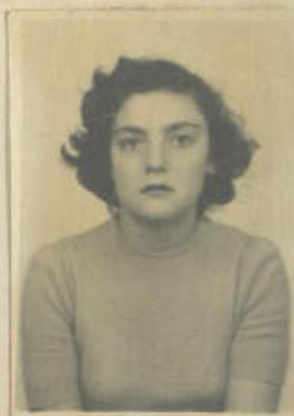
FOTOGRAFIA DE FRENTE