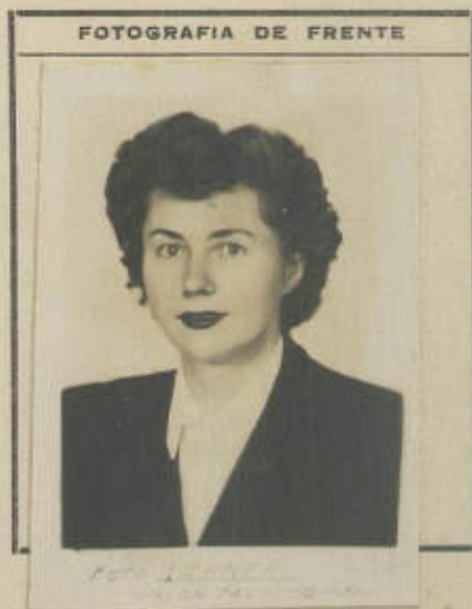
FOTOGRAFIA DE FRENTE