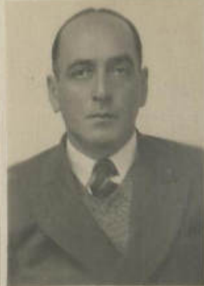
FOTOGRAFIA DE FRENTE