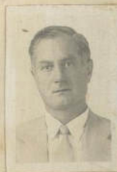
FOTOGRAFIA DE FRENTE