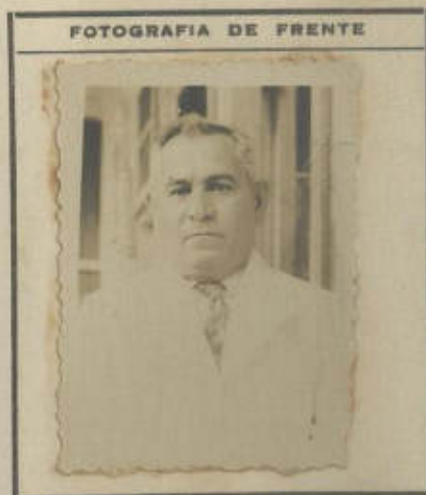
FOTOGRAFIA DE FRENTE