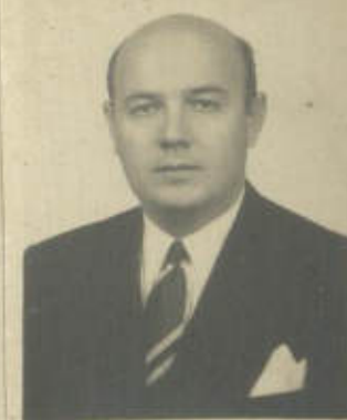
FOTOGRAFIA DE FRENTE