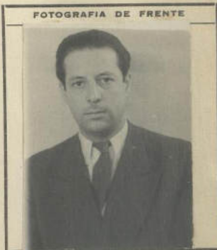
FOTOGRAFIA DE FRENTE