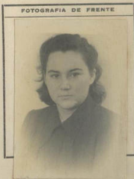
FOTOGRAFIA DE FRENTE