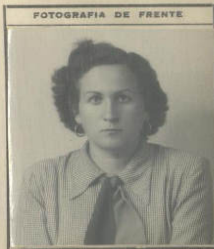
FOTOGRAFIA DE FRENTE