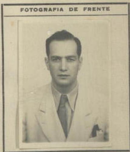
FOTOGRAFIA DE FRENTE

Estatura: 1.78 m. Cabellos: Negro Ojos: Pardos Sexo: Masculino Estado Civil: Casado Señas Particulares: _____