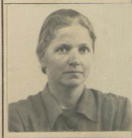
FOTOGRAFIA DE FRENTE