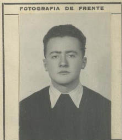
FOTOGRAFIA DE FRENTE