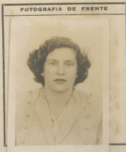
FOTOGRAFIA DE FRENTE