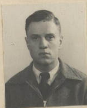
FOTOGRAFIA DE FRENTE