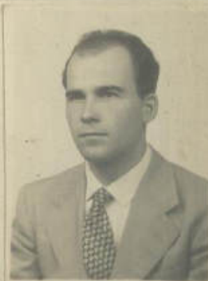
FOTOGRAFIA DE FRENTE