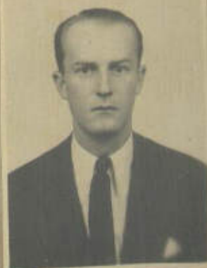
FOTOGRAFIA DE FRENTE