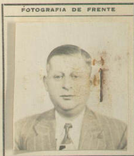
FOTOGRAFIA DE FRENTE