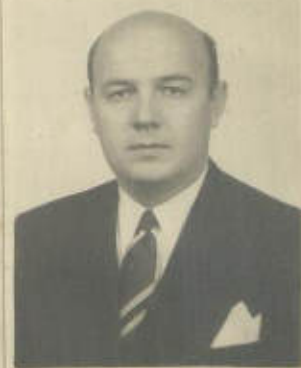
FOTOGRAFIA DE FRENTE