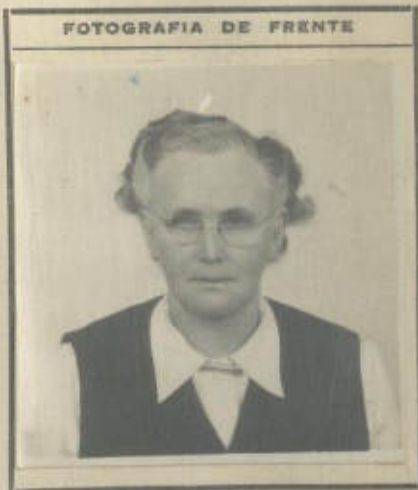
FOTOGRAFIA DE FRENTE